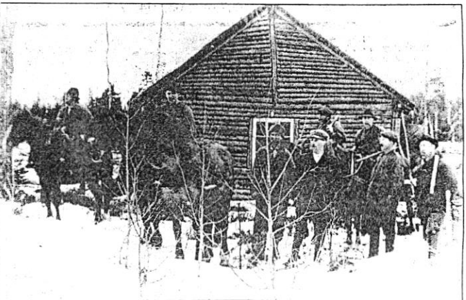
Bönder från Trätlanda i Blomskog-på skogskörning, troligen i Djuv, Silbodalen vintern 1912.